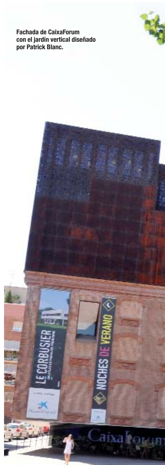
Fachada de CaixaForum con el jardín vertical diseñado por Patrick Blanc.

Seguramente el lector está pensando ahora que quedarse en, digamos, lo bueno hace que se olvide, digamos también, lo malo que trajeron las muchas batallas, las ansias de conquista, la esclavi-