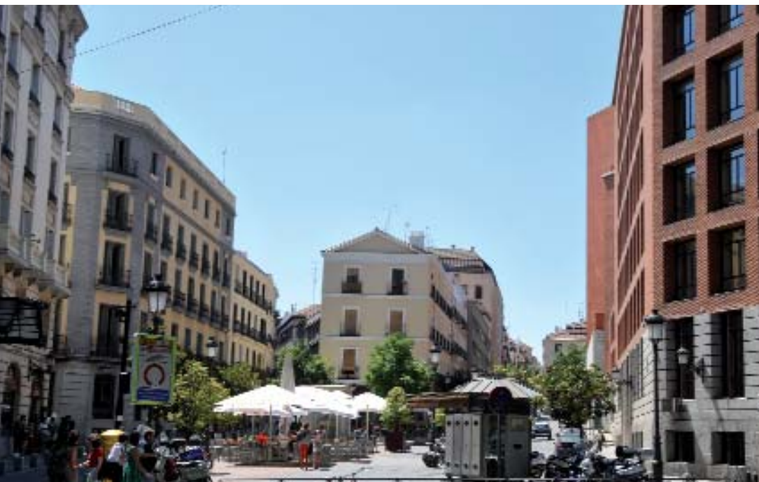
A la izquierda, la zona de Huertas abierta al Paseo del Prado. Debajo, Neptuno vigila el “Mar de Madrid” que forma parte del Mediterráneo.