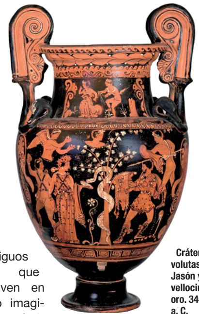
Crátera de volutas con Jasón y el vellocino de oro. 340-330 a. C.