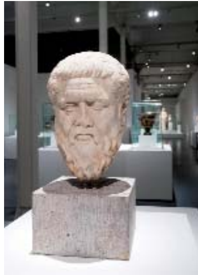
“Cabeza de Platón”.