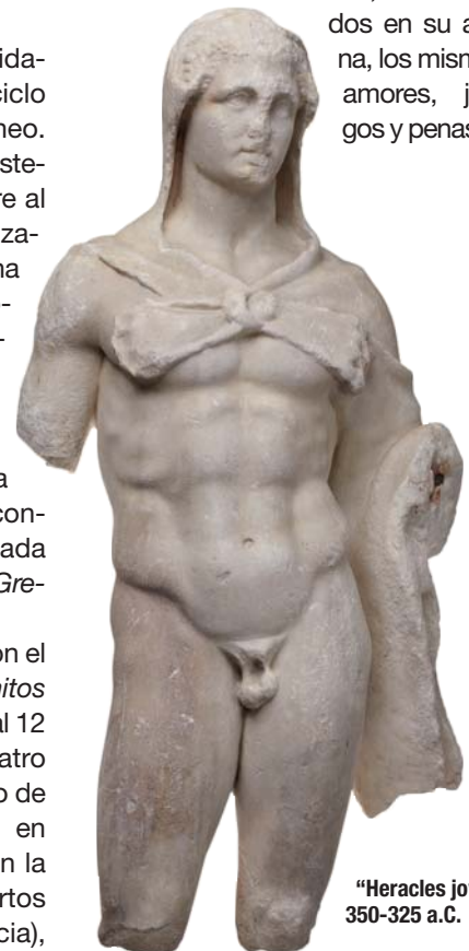
“Heracles joven”. 350-325 a.C.

Otras buenas propuestas son el ciclo de cine En busca de los mitos escondidos , del 31 de octubre al 12 de diciembre; el ciclo de cuatro conciertos con el título genérico de La Mediterránea, ayer y hoy , en octubre, y músicas surgidas en la isla de Cerdeña, en los puertos romanos de Occitania (Francia),