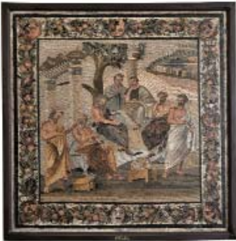
“La academia de Platón”. 110-80 a.C.