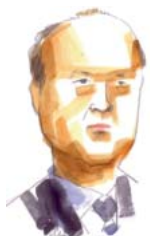
JUAN CARLOS CAMPO, Diputado del Grupo Parlamentario Socialista. Portavoz de la Comisión de Justicia

En ese marco, las actuaciones han de dirigirse a atender las actuales necesidades para adecuar la planta judicial y, con ello, la planificación de recursos humanos con mejor organización y reparto de cargas de trabajo. Impulsar el avance irrenunciable en la modernización de sistemas de gestión. La transformación y racionalización de la regulación procesal, acorde con nuevos retos y necesidades. La incorporación de mecanismos que permitan el consenso sobre el gobierno del poder judicial. Y, en definitiva, proporcionar estabilidad a las grandes reformas.