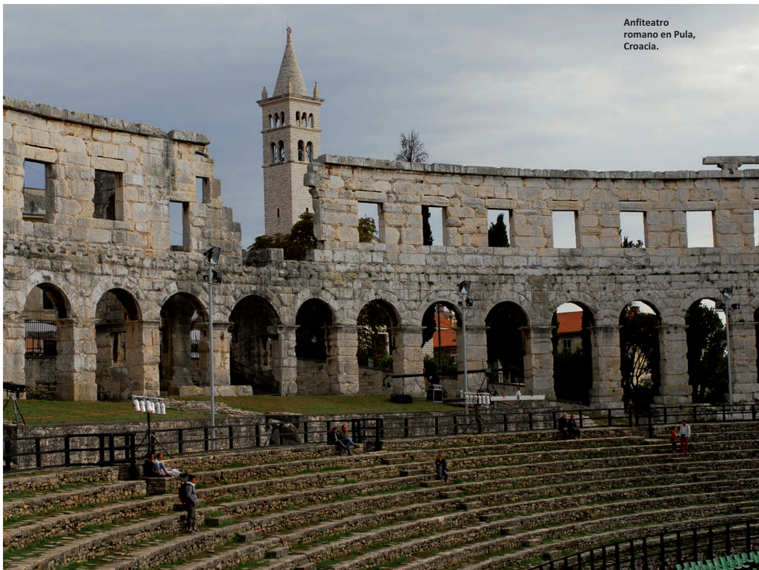
Anfiteatro romano en Pula, Croacia.

No es de extrañar por todo ello que las autoridades europeas aceptaran con entusiasmo la propuesta llevada a cabo en 2014 por Italia, Alemania, Francia y España