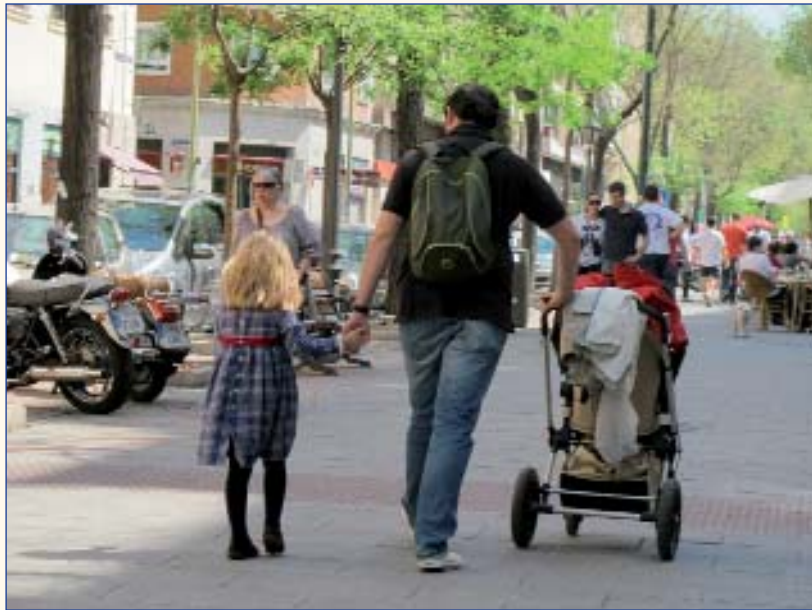
Esta sentencia corrige una insolidaridad que casi siempre afectaba a las mujeres.

EN el año 2010 se produjeron 110.321 disoluciones de matrimonios, un 3,9 por ciento más que en 2009. De esta manera se rompe la tendencia descendente de las rupturas iniciada en 2007. Los divorcios representaron el 93,3 por ciento de las rupturas matrimoniales en el año 2010, frente al 6,6 por ciento de las separaciones y el 0,1 por ciento de las nulidades. De esta forma, se consolida la tendencia al alza de los divorcios en el global de las disoluciones matrimoniales.