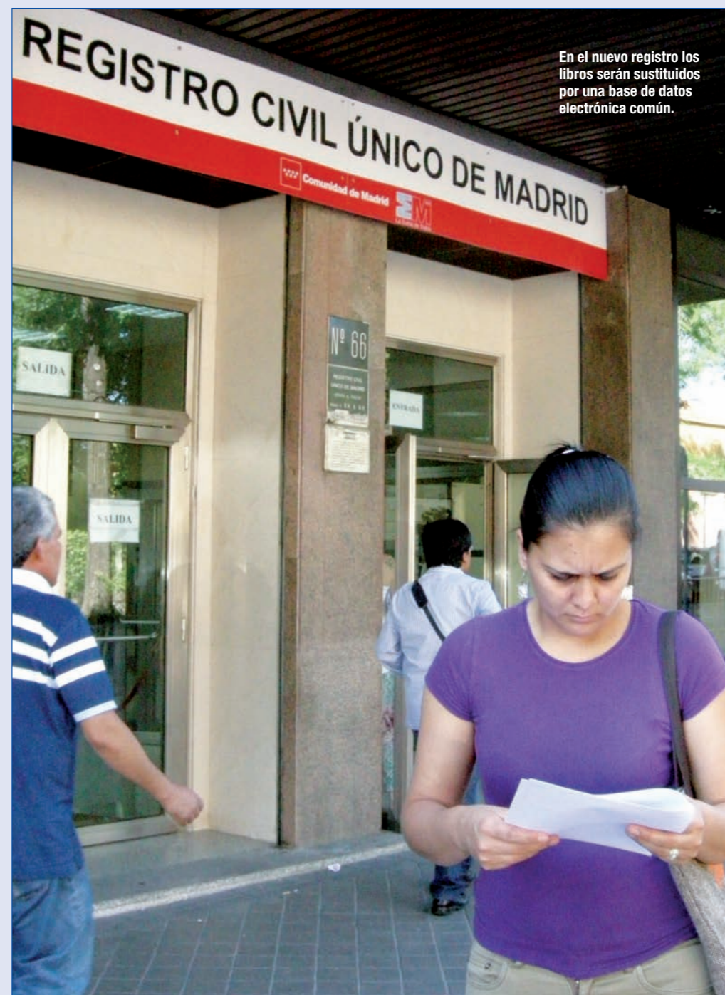
En el nuevo registro los libros serán sustituidos por una base de datos electrónica común.

En el nuevo registro los libros serán sustituidos por una base de datos electrónica común, de manera que el ciudadano podrá realizar sus trámites en cualquier oficina del país. Es más, muchas veces no tendrá ni siquiera que ir personalmente al registro, ya que la gran mayoría de los trámites se harán directamente desde las Administraciones Públicas. Los hospitales se encargarán de hacer el envío electrónico de la información necesaria para inscribir nacimientos y defunciones; y los ayuntamientos harán