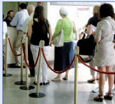
Los libros de familia serán sustituidos por certificaciones registrales que podrán solicitarse personalmente o vía Internet.

Será además un registro desjudicializado, que operará como una