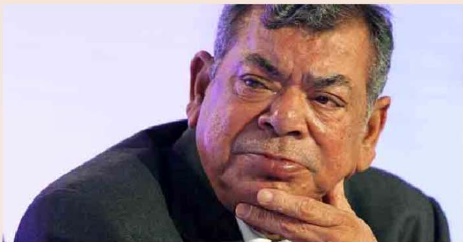
El presidente de Essar, Shashi Ruia.

Repsol vuelve en 2011 a primera línea de los movimientos corporativos en el mercado energético. El conglomerado indio Essar analiza diversas opciones para convertirse en uno de los accionistas de referencia de la petrolera española con la compra, al menos, de un 5% del capital que, a precios de mercado, tendría un valor de más de 1.300 millones de euros. El gigante asiático, con intereses en energía, telecomunicaciones y acero, podría adquirir la participación directamente en bolsa. Una alternativa es comprar el 5% que tienen La Caixa y CatalunyaCaixa a través de Repinves, o adquirir parte de la participación del primer accionista, Sacyr, que posee el 20%. P3/LA LLAVE