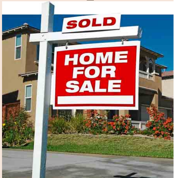
En EEUU ha existido un proceso masivo de ejecuciones hipotecarias.