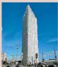
Telefónica se traslada en Barcelona a la torre Diagonal ZeroZero P14