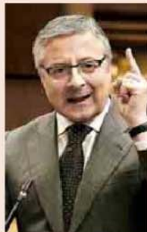
José Blanco, ministro de Fomento.

sión de trabajo el próximo 2 de febrero. En ella, se abordarán medidas que ayuden a digerir el stock, el acceso a la financiación y la reforma de la Ley de Suelo. P4/LA LLAVE