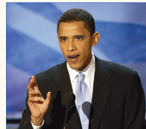
El republicano Rudolph Giuliani (izquierda, arriba) y el demócrata Barack Obama (derecha, arriba) tendrán un difícil rival en una Hillary Clinton (abajo) que cuenta con el apoyo mediático de su marido, Bill.