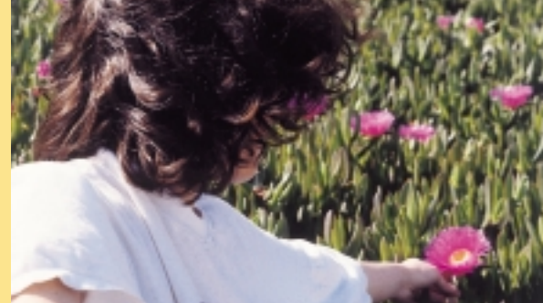
En los últimos cinco años, la violencia doméstica se ha cobrado la vida de más de 300 mujeres.

Ley Integral contra la Violencia de Género abarca aspectos preventivos, educativos, sociales y asistenciales, así como todo lo relacionado con las normas civiles que afectan al ámbito familiar -donde se producen principalmente las agresiones- y las normas penales que castigan esos delitos. Además, prevé impartir formación específica a los diferentes profesionales