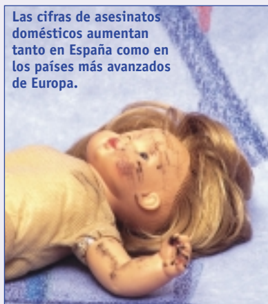
Las cifras de asesinatos domésticos aumentan tanto en España como en los países más avanzados de Europa.

El cambio es complicado porque “exige modificar mentalidades muy arraigadas”, recuerda Mercè Pigem (CIU). Esta diputada