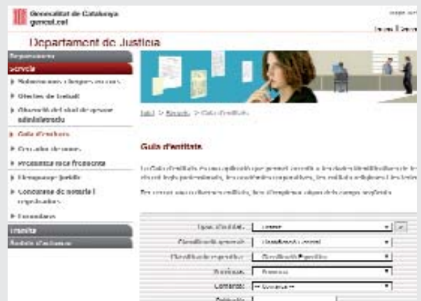
Imagen del Registro de Asociaciones y Fundaciones de la Generalitat de Cataluña.

Este proyecto se inició con el convenio de colaboración para establecer un sistema de interoperabilidad entre el Colegio Notarial de Cataluña y el Departamento de Justicia suscrito en junio de 2013.