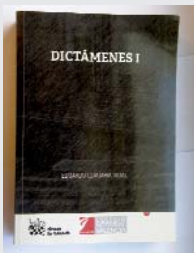
Portada del libro.

Como se señala en su presentación, el objetivo de este libro es dotar de "un sistema para explicar el derecho privado; desde lo más básico a lo más complejo, consiguiendo, a base de ejemplos, que el lector o el opositor penetre en los entresijos del mismo. En realidad contiene lo que el autor denomina 'cursillo básico de dictámenes', para los alumnos de notarías, y que ha ido formando durante más de cuarenta años en la profesión y en la docencia. Consta de lo que él