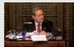
Francisco Marín Castán, presidente de la sala primera del Tribunal Supremo.

valdrá a la ‘desinformación’ sino hacerle saber los riesgos principales.”