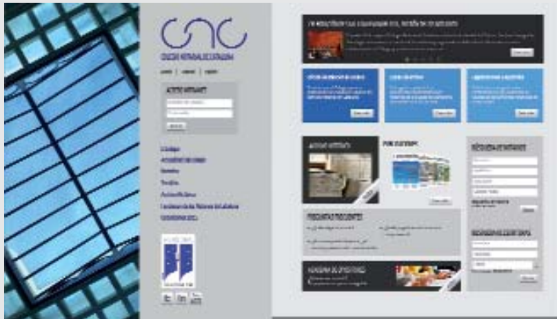
Página web de las oposiciones.

La oposición consta de dos tribunales. Cada uno está presidido por un notario y constituido por seis vocales, entre ellos dos notarios, un registrador de la propiedad, un abogado del Estado, un profesor universitario de Derecho Civil y un magistrado. El sorteo para determinar el orden de intervención de los 831 opositores se realizó mediante un algoritmo aleatorio. Al finalizar cada exposición, el tribunal delibera y, al acabar la jornada, emite su veredicto y hace público el resultado de los exámenes de ese día. El secretario de cada uno de los tribunales cuelga la lista en el mismo Colegio y, al tiempo, los resultados también son accesibles on line en la web www.notarisdecataluña.org . Desde esta página también se puede hacer el seguimiento de “las oposiciones al minuto”, donde se informa en tiempo real del momento en que cada opositor inicia la prueba y de los que se retiran o la abandonan.