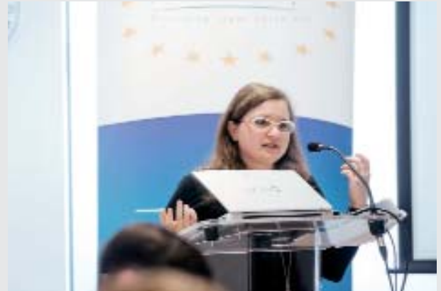
Annelisa Cotone, consultora sobre los derechos de las personas con discapacidad en la Comisión Europea.