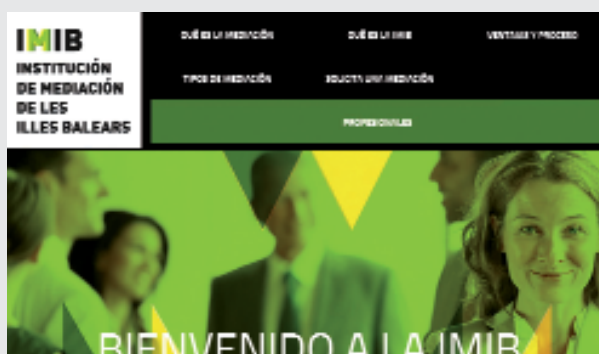
Página web de la Institución de Mediación de las Islas Baleares www.imibalears.es

El Colegio Notarial de Baleares, la Cámara de Comercio de Ibiza y Formentera y el Colegio de Abogados de esta Comunidad Autónoma, junto a otros profesionales jurídicos, han puesto en marcha la Institución de Mediación de las Islas Baleares.