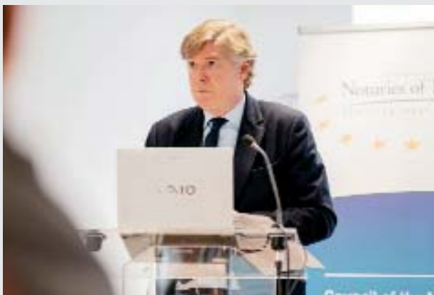
Antonio López Istúriz, secretario General del Partido Popular Europeo (PPE) y diputado del PP en el Parlamento Europeo.