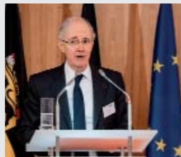
El presidente del CNUE, Jean Tarrade, inauguró la conferencia.

Compartimos con el Plan 2020 que el campo en el que podemos desarrollar nuestra actividad de mediadores es muy amplio, e insistimos en que, además de sucesorio, el campo de la mediación en conflictos mercantiles entre empresas y en conflictos intra empresariales (entre socios, en empresas familiares, etc...) resultaba, a nuestro juicio, muy prometedor para los notarios.