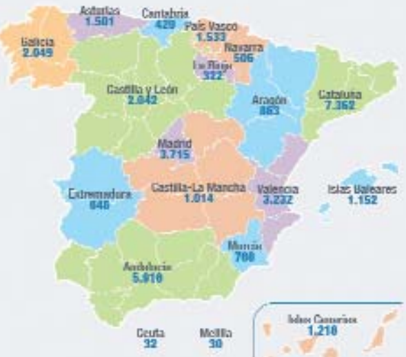
RENUNCIAS DE HERENCIAS EN 2014 POR CC.LL.