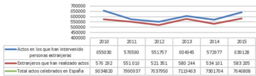
Actos notariales y número de extranjeros

Servicios más demandados. Los apoderamientos, documentos públicos que permiten a una persona o empresa designar a otra como su representante en determinados actos jurídicos, suponen casi tres de cada diez actos notariales realizados por ciudadanos extranjeros (27% del total). El Consejo General del Notariado tiene registradas a personas de 200 nacionalidades que han pedido este servicio, desde los británicos, con más de 24.000 actos