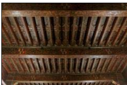
Detalle del alfarge que se ubica en la techumbre de la biblioteca del archivo