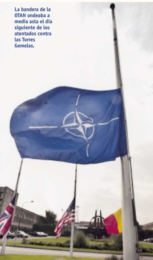
La bandera de la OTAN ondeaba a media asta el día siguiente de los atentados contra las Torres Gemelas.

El renacimiento del unilateralismo en EE.UU. y la pérdida de influencia en política exterior y de seguridad de Europa amenazan el futuro de la OTAN. La ironía de esta dramática situación es que se produce en paralelo a la adhesión de otros siete socios del Este europeo que ya acompañan en el club militar más importante del planeta a Polonia, Hungría y la República Checa, integrados en 1999, y cuando las relaciones con su otrora enemigo, Rusia, son más cordiales que nunca. La estrategia de la Casa Blanca de convertir a la Alianza Atlántica en una fuerza de intervención rápida para luchar contra el terrorismo puede ser su tabla de salvación. Pero la denominada doctrina Bush parece demasiado modesta para una organización que ha comandado y gestionado los últimos grandes conflictos internacionales.