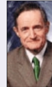
Francis Mer, Ministro de Economía francés:

"Esta vieja Europa ha sido, es y será el motor de la construcción europea. Ha resistido a los malos tiempos y es capaz de renacer. Nuestra oposición a la guerra contra Irak no es por viejos, sino por sabios."