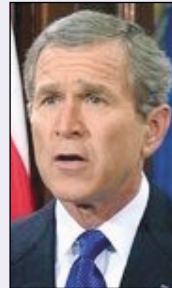
George W. Bush Presidente de Estados Unidos:

"Las declaraciones de integración de los nuevos socios del Este tienen que ser refrendadas con hechos. Debemos ser aliados en la batalla contra el terrorismo, pero también compartir valores comunes. Por eso deseamos que los nuevos miembros creen mayores niveles de convivencia y democracia."