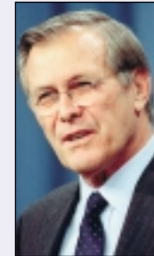
Donald Rumsfeld, Secretario de Defensa de EE.UU.:

"Con la última expansión de la OTAN el eje de decisión en el Viejo Continente se ha desplazado hacia el Este y estos países, junto a Reino Unido, España e Italia, son los estandartes de la nueva Europa."